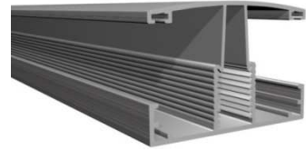
ABERTURA MAXIMA 22 mm