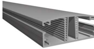
ABERTURA MINIMA 4 mm